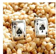
Botões de punho de póker de Paula Santacruz