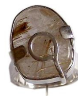
Anel de quartzo de Simon Ourivesaria