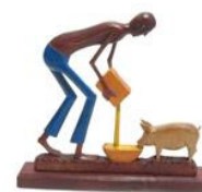
Escultura de Oaso Artesanato