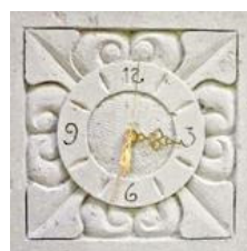
Relógio de parede de pedra de Canoro