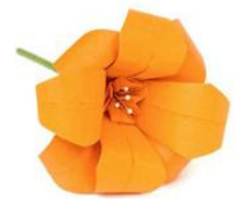
Lirios de Papel de Enpapelarte