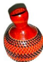
Xequerê de Tati Xequerê Ateliê