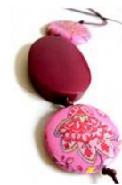
Collar flores malva de Cuentacuentas