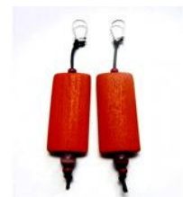
Pendientes madera naranja de Kukala