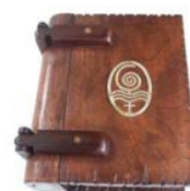
Caja libro de Cajitasmagicas