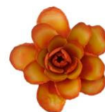
Rosa laranja de Paulooliveiraartesanato