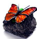
Borboleta de Garcia Studio

Nhanduti de Atibaia , associação sem fins lucrativos, dedicada-se ao resgate da técnica da renda tenerife. A sua proposta de hoje: uma toalha redonda!