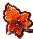
Cinzeiro folha de Artec