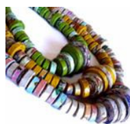
Colar de papel de Js Design Sustentavel

Para elaborar esta mesa de xadrez e damas , usou diversas madeiras: nogueira, cerejeira, teca, amieiro e pinho russo formam o quadriculado maciço ao que, aos olhos de um perito, será difícil resistir.