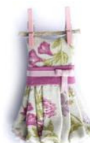
Pregadeira vestido estendido de Jarrillo De Lata