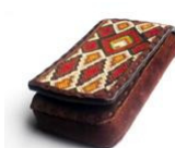
Portacelular de Quiron Cuero