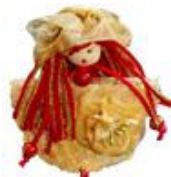
Broche de Las Muñecas De Mama