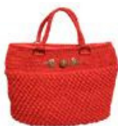
Bolsa de Maravillas de Ganchillo