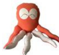
Boneco polvo de Chicamama