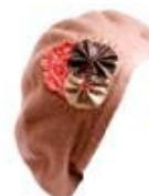
Boina de lã de La Muka