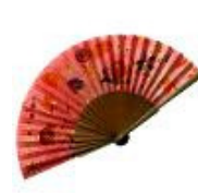
Leque de seda de Pinturasobreda