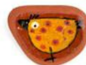
Pregadeira de Corda Bamba