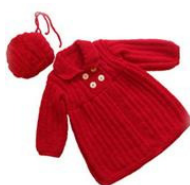
Abrigos de lã de algodão de La Abuelita Marisa

Depois de muita pesquisa, de tecidos e novas técnicas, começaram por criar roupas totalmente feitas à mão. Passaram por São Paulo, e finalmente abriram um novo atelier de acessórios , em Barcelona. Musa Bamba apresenta a bolsa Origami , com design inspirado na técnica japonesa, feita de fuxico , e adaptável em tamanho e forma. Um presente perfeito para uma mulher moderna!