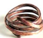
Anel de cobre Bruno de I Bijoux Di Angel