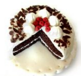
Pregadeira bosque negro de Tampinha