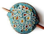
Acessório com âmbar de Criterio - Критерий