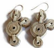
Brincos de papel de Js Design Sustentavel