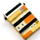
Pingente de madeira de Klimika