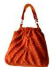
Sacola de Oltrelalana Accessori In Lana&