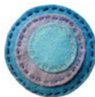
Broche de feltro de Farbalans