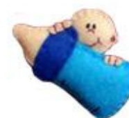
Broche batismo de Ainhoa Todoamano