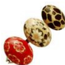
O Cantinho de Ametista