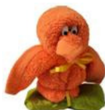
Pulcino de Origamani