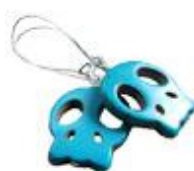
Brincos de Hawlita de Sandstar Jewelry Designs